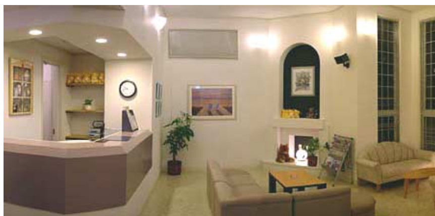
「秋田六郷店」ラウンジ