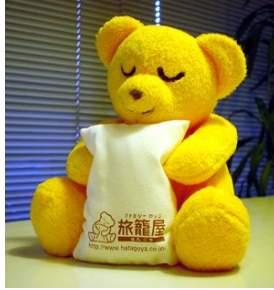
玩偶 1000 日圓