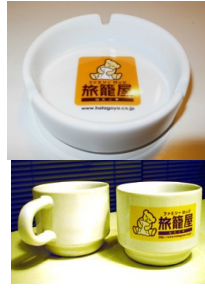
煙灰缸 / 馬克杯 各 500 日圓