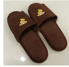
室內拖鞋 100 日圓